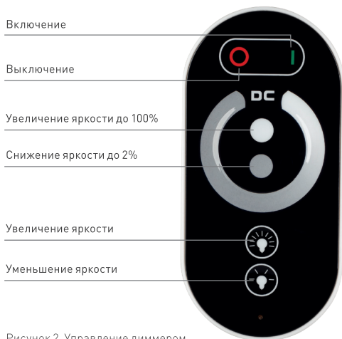
Рисунок 2. Управление диммером.